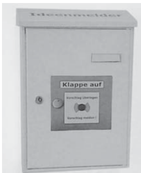
Abbildung 1: Briefkasten oder Feuermelder?

Briefkästen, in Anlehnung an einen Feuermelder, bilden die Schnittstelle zwischen den Ideengebern und dem Team des Ideenmanagements. Die leuchtend gelben Briefkästen wurden an zentralen Plätzen der Standorte als Ideenmelder installiert und wöchentlich von den verantwortlichen Teammitgliedern entleert. Zu Beginn des Semesters wird an zwei Standorten der FHTW ein Stand mit Kaffee und Kuchen als Informationsplattform organisiert. Dafür teilt sich das Team des Ideenmanagements in zwei Gruppen auf. Beide Gruppen diskutieren und planen dar-